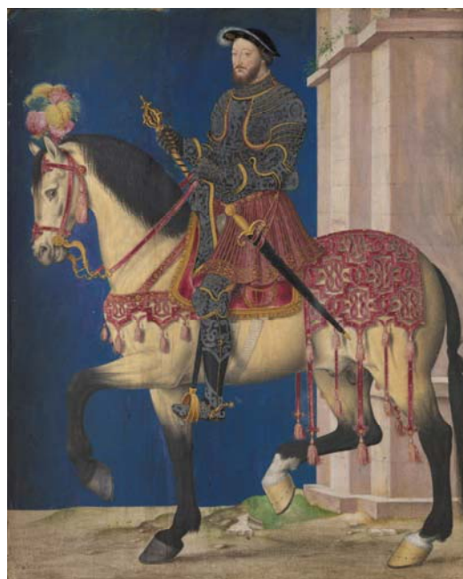
Jean Clouet, Portrait équestre de François I er, musée du Louvre