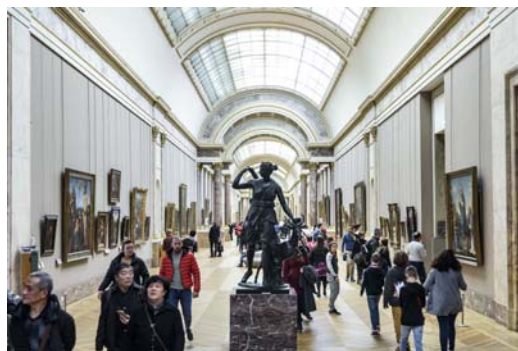
La Grande Galerie du Louvre

Le Louvre s'est également rendu à la rencontre de son public sur le territoire national et à l'international . Environ 1 million de visiteurs ont pu découvrir les expositions du Louvre telles que « La Figure d'Eve » au musée Rolin d'Autun ou « L'invention du Louvre » à Hong Kong et à Pékin ainsi que l'exposition consacrée à la bande dessinée « L'Ouvre 9 » au Japon.