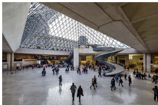
Vue sous la pyramide