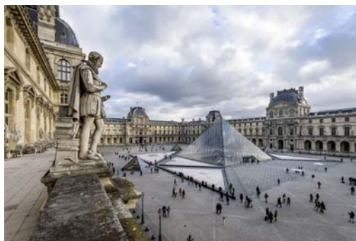
Vue de la pyramide

Environ 300 000 visiteurs ont découvert les expositions de la Petite Galerie en 2017 : « Corps en mouvement » (du 6 octobre 2016 au 3 juillet 2017) et « Théâtre du pouvoir » (du 25 septembre 2017 au 5 juillet 2018).