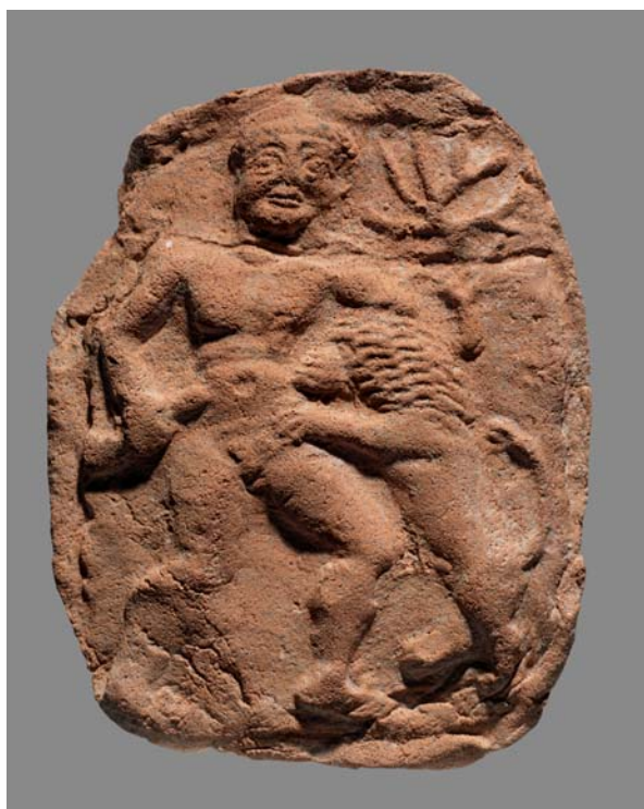
9- Héraclès et le lion de Némée, Suse, périodes séleucide et parthe (-305/-64), terre cuite, Paris, musée du Louvre.