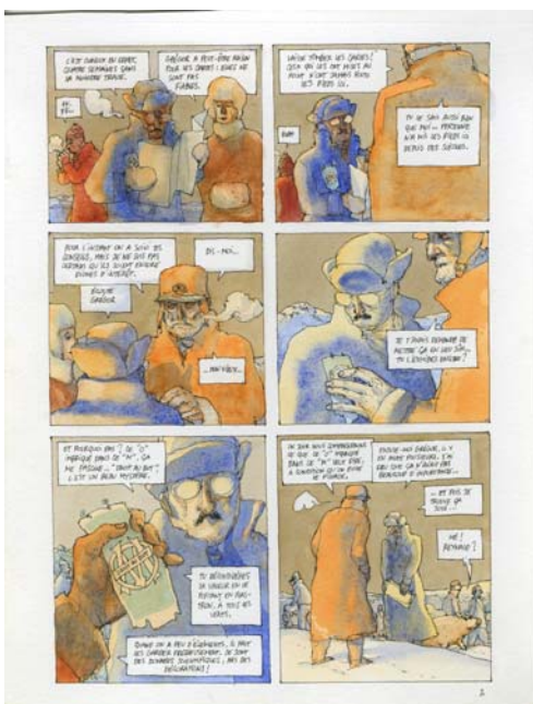
7- Nicolas de Crécy, Période Glaciaire , page 5, 2005, Futuropolis, Musée du Louvre Éditions. © Nicolas de Crécy