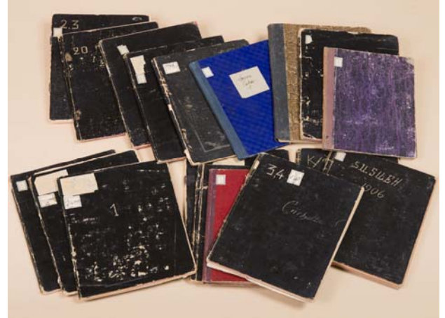
5- Journaux de fouille de George Legrain