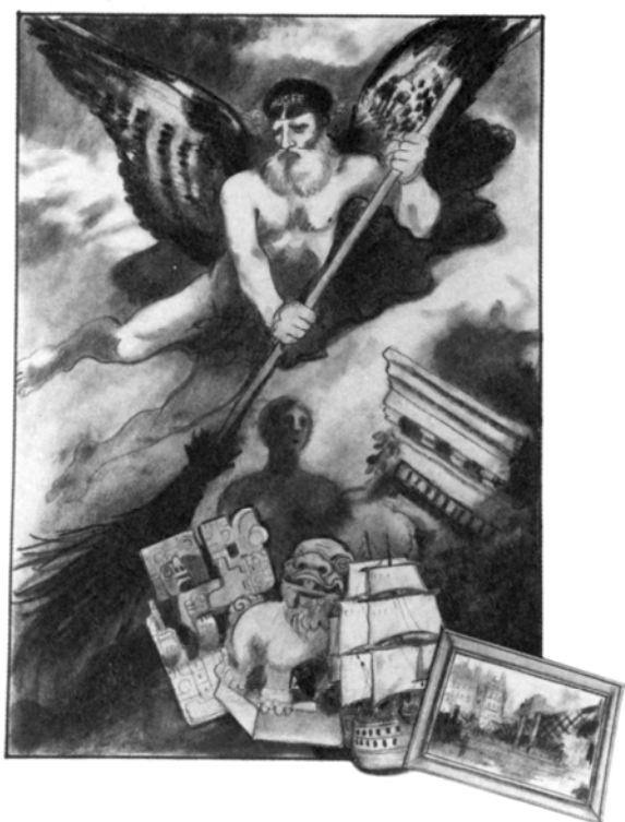
1- Jacques Tardi, sans titre, fusain © Tardi 2018