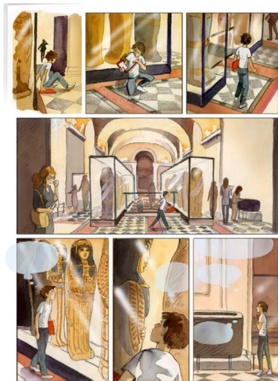
12- Isabelle Dethan, Gaspard et la malédiction du prince fantôme , 2017, Éditions Delcourt, Musée du Louvre Éditions.