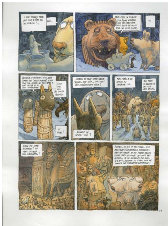
15- Nicolas de Crécy, Période Glaciaire , page 56, 2005, Futuropolis, Musée du Louvre Éditions. © Nicolas de Crécy