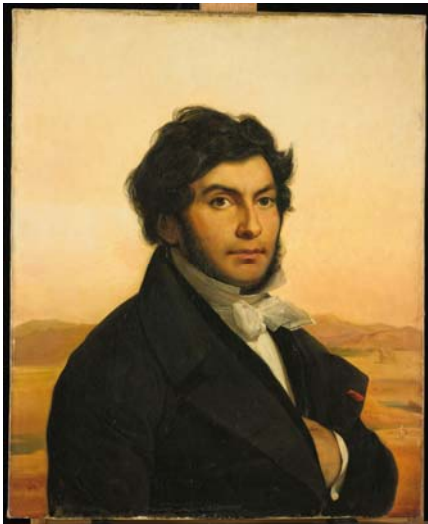
6- Léon Cogniet, Jean-François Champollion (1790-1832), égyptologue, 1831, huile sur toile, Paris, musée du Louvre.