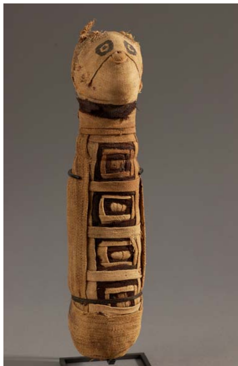
14- Momie de chat, Basse-Époque (-664/-332), momie d'animal et étoffe peinte, Paris, musée du Louvre.