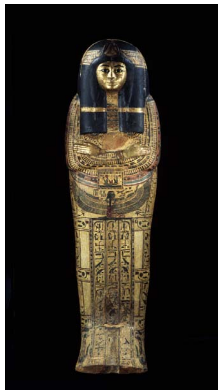
13- Cuve de cercueil extérieur de Tamoutnéfret, époque ramesside (-1295/-1069), bois doré, incrusté, peint et stucqué.