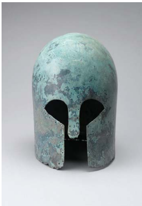
16- Casque de type corinthien, début du VII e siècle avant J.-C., bronze, Paris, musée du Louvre.