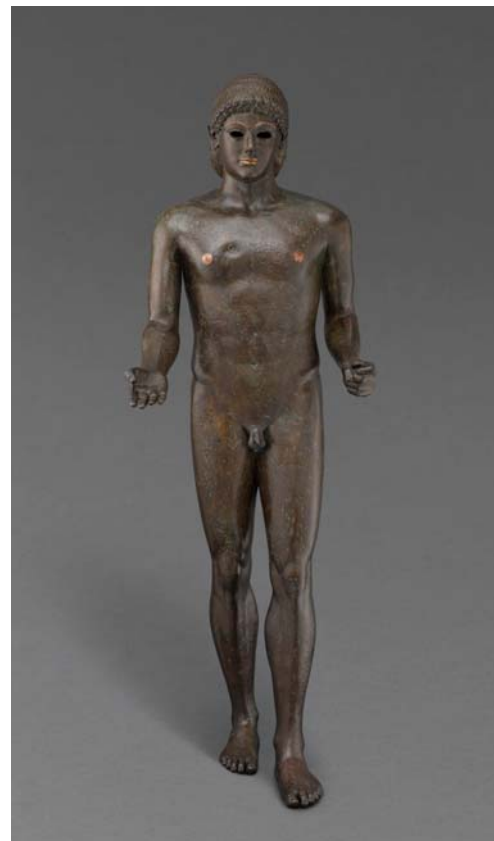
8- Apollon de Piombino, Piombino, -125/-100, bronze, Paris, musée du Louvre.