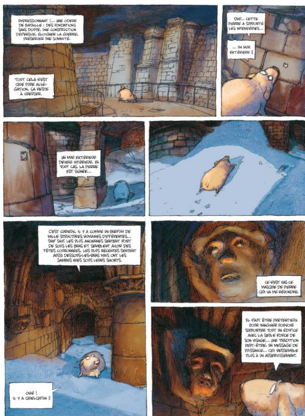
18- Nicolas de Crécy, Période Glaciaire , page 26 © Nicolas de Crécy / Futuropolis / musée du Louvre Editions