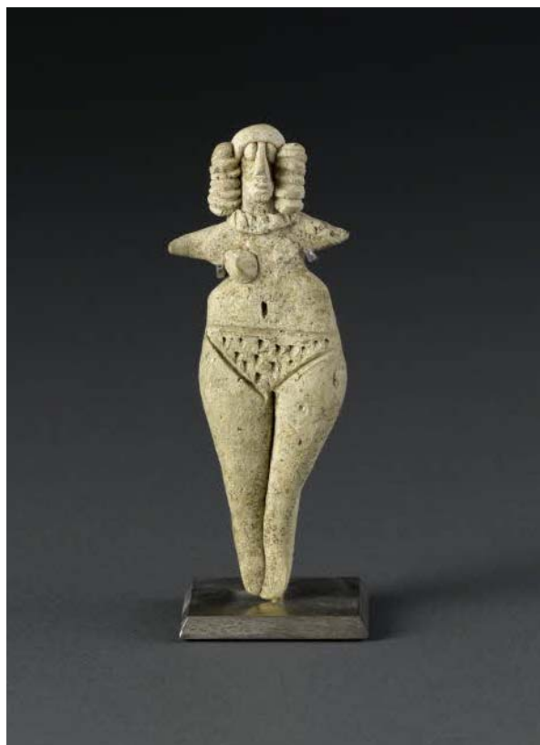
10- Femme nue aux bras en ailerons, musée du Louvre, département des antiquités orientales