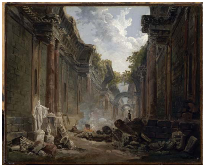
19- Hubert Robert, Vue imaginaire de la Grande Galerie du Louvre en ruines, 1775-1800, huile sur toile, Paris, musée du Louvre.