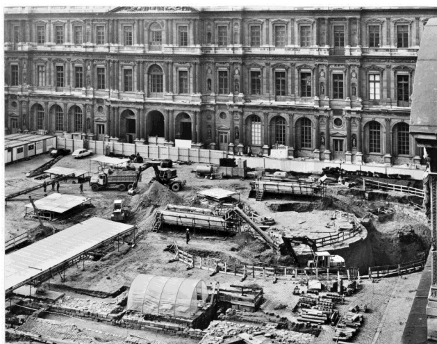
Vue des fouilles entreprises Cour Carrée

La Pyramide suscite de nombreuses polémiques dans la presse et déclenche les passions à la fois esthétiques et techniques. Une simulation grandeur nature est réalisée sur le site. En mai 1985, le maire de Paris, Jacques Chirac, se rend sur les lieux et donne un avis favorable au projet.