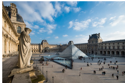
La Pyramide du Louvre

La Pyramide est aujourd'hui l'une des icônes du musée le plus célèbre au monde. En 2018, le musée du Louvre a accueilli plus de 10 millions de visiteurs, dont près de 70% d'étrangers. Le Grand Louvre a révolutionné l'accueil du public, en facilitant les déplacements d'une aile à l'autre et en lui proposant des services nouveaux (cafétéria, librairie-boutique, auditorium...).