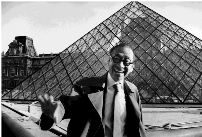
Ieoh Ming Pei devant la Pyramide