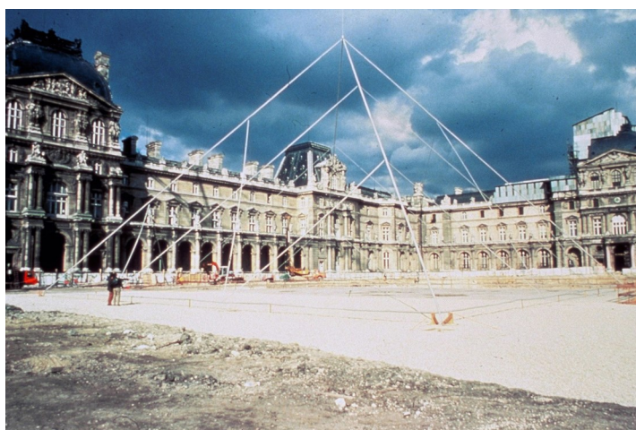
Simulation de la Pyramide dans la cour Napoléon, mai 1985