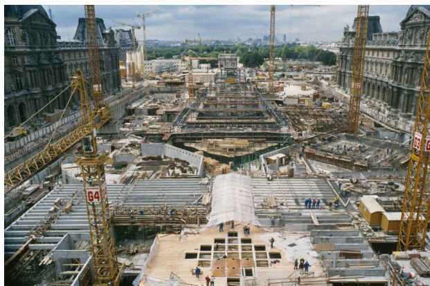
Travaux de la cour Napoléon, 5 juin 1987