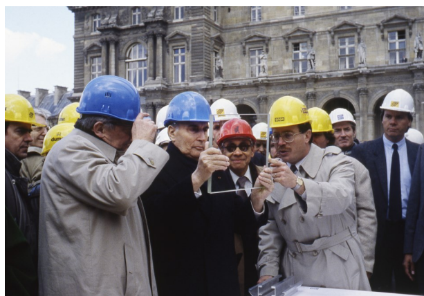
Sur le chantier de la Pyramide, F. Mitterrand et I. M. Pei découvrent des échantillons du verre conçu par l'entreprise Saint-Gobain, 1988