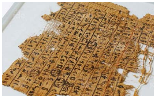
Le papyrus oublié de la grande pyramide de Gwyn Williams, 2017

La Mésopotamie Nord est la zone la plus dense en sites à fouiller de tout le Moyen Orient. Longtemps tenue à l'écart des grandes expéditions archéologiques du XX e siècle pour des raisons