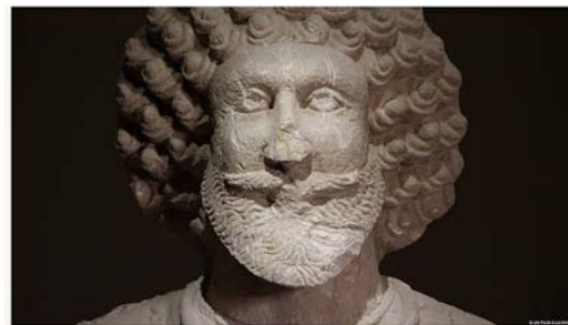
Mésopotamie, une civilisation oubliée de Yann Coquart et Luis Miranda, 2017 © Un Film à la patte

Le film est le récit de cette aventure archéologique incroyable où, entre passé et présent, le savoir scientifique devient une réponse à l'oubli.