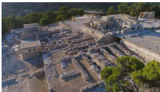
Enquêtes archéologiques : Crète, le mythe du labyrinthe de Agnès Molia et Mikael Lefrançois, 2018 © Tournez s'il vous plaît