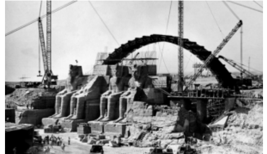
Égypte, les temples sauvés du Nil d'Olivier Lemaître, 2017

Au fil du Nil, le film croise les traces des pharaons, de Ramsès II à Cléopâtre, jusqu'aux Romains et l'histoire mouvementée de leurs temples jusqu'à leur sauvetage. Il se lance aussi un défi : celui de reconstituer en numérique les couleurs de ces temples jadis peints. Grâce à l'archéologie et à la finesse de techniques 3D, nous pouvons les imaginer dans leur environnement à jamais perdu. Ce voyage dans le sud de l'Égypte ouvre les portes d'un patrimoine exceptionnel, sauvé par une mobilisation internationale au nom de l'humanité.