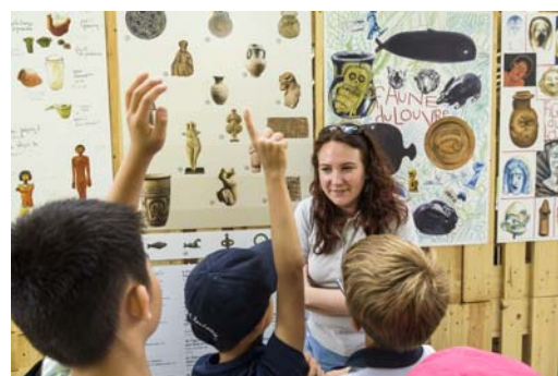
L'espace Louvre à Paris Plages, été 2018