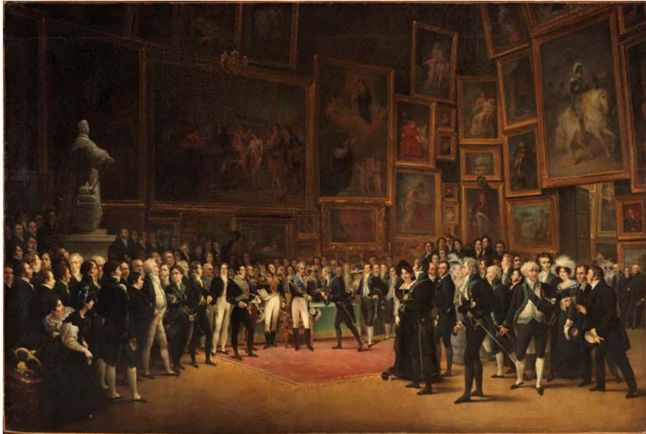
13– François-Joseph Heim, Charles X (1824-1830) distribuant des récompenses aux artistes exposants du Salon de 1824 au Louvre, le 15 janvier 1825, 1825, Salon de 1827, huile sur toile, 2,09 x 2,86 m, Paris, musée du Louvre, département des Peintures, INV 53 13