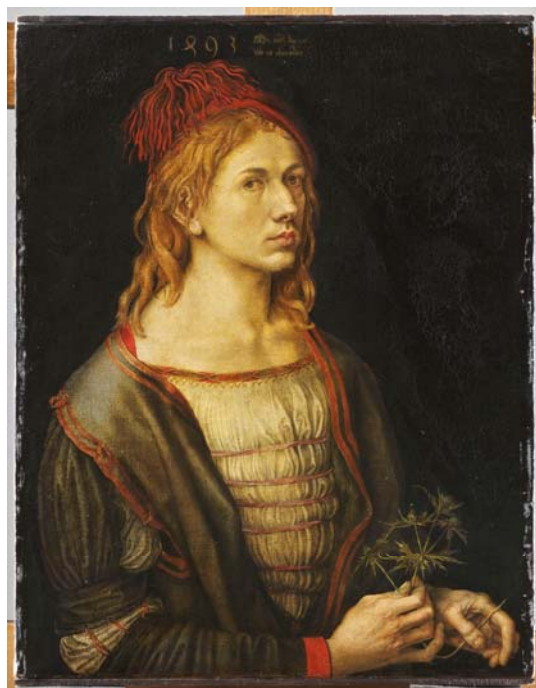
5– Albrecht Dürer, Portrait de l'artiste tenant un chardon , 1493, parchemin collé sur toile, 72 x 59 cm, Paris, musée du Louvre, département des Peintures, RF 2382