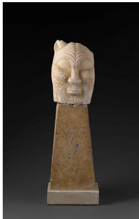
2– Eschmounillec, sculpteur actif à Chypre au VII e siècle av. J.-C., Monument offert au dieu Bès. Lanarca (Chypre), 750-600 avant J.-C., calcaire, 68 x 29 cm, Paris, musée du Louvre, département des Antiquités orientales, AM 1196