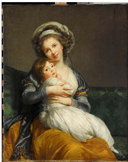
7– Élisabeth Louise Vigée Le Brun, Madame Vigée Le Brun et sa fille , 1786, huile sur bois, 1,32 x 1,12 m, Paris, musée du Louvre, département des Peintures, INV 3069