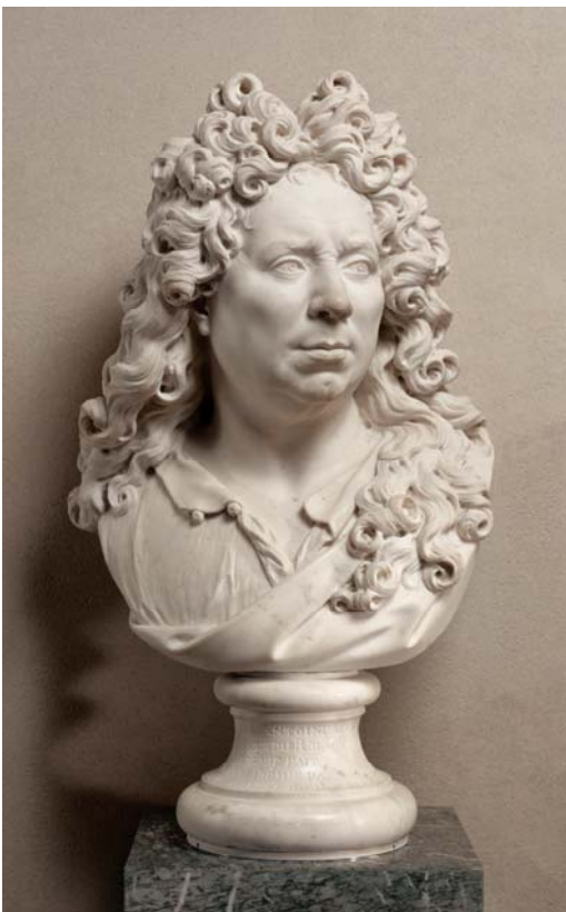
11– Antoine Coysevox, Autoportrait , 1679, marbre, 54 x 40 x 26 cm, Paris, musée du Louvre, département des Sculptures, MR 2159