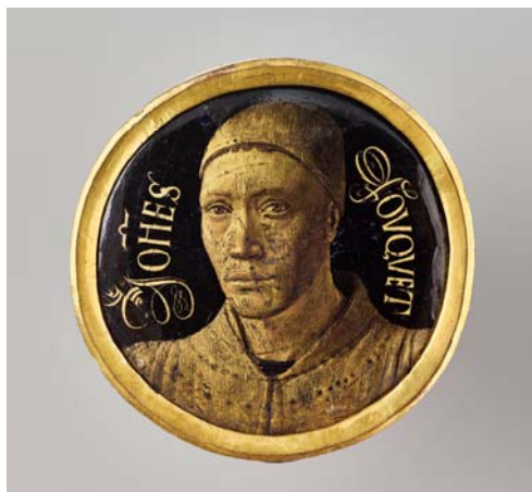
4– Jean Fouquet, Autoportrait , vers 1452, émail et camaïeu d'or sur cuivre, D. 6 cm, Paris, musée du Louvre, département des Objets d'art, OA 56