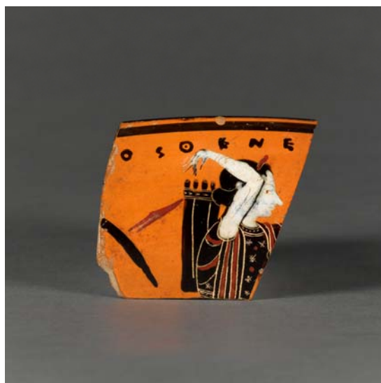
1– Nicosthénès, potier actif à Athènes (Grèce actuelle), vers 540 avant J.-C., Fragment de coupe , vers 530-520 avant J.-C., argile, 5,1 cm, Paris, musée du Louvre, département des Antiquités grecques, étrusques et romaines, CA 1854