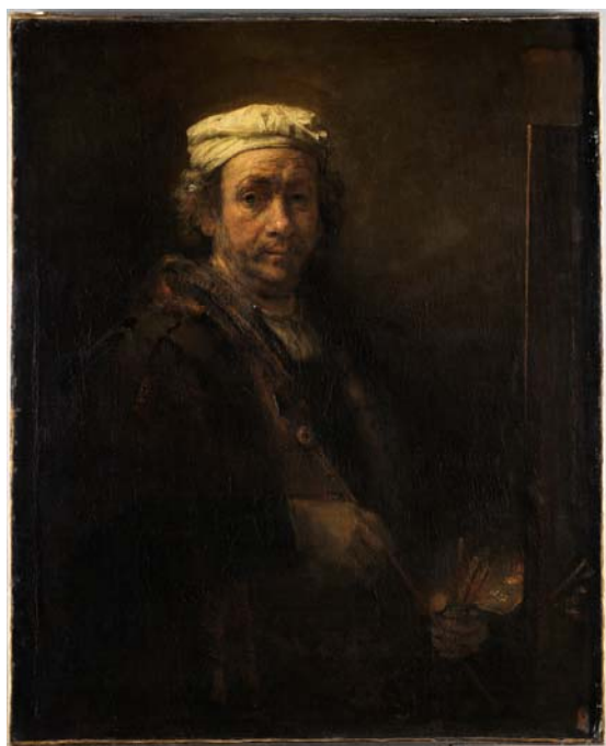
6– Harmensz. Van Rijn, dit Rembrandt, Portrait de l'artiste au chevalet , 1660, huile sur toile, 1,10 x 0,85 m, Paris, musée du Louvre, département des Peintures, INV 1747