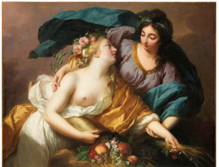
14– Élisabeth Louise Vigée Le Brun, La Paix ramenant l'Abondance , 1780, Salon de 1783, huile sur toile, 1,03 x 1,33 m, Paris, musée du Louvre, département des Peintures, INV 3052