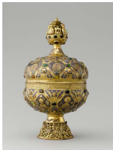
3– Maître Alpais, orfèvre actif à Limoges (France) au XIII e siècle après J.-C., Ciboire , vers 1200 après J.-C., cuivre émaillé et doré, 30,1 x 16,8 cm, Paris, musée du Louvre, département des Objets d'art, MRR 98