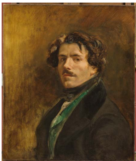
8– Eugène Delacroix, Portrait de l'artiste dit « au gilet vert » , vers 1837, huile sur toile, 88 x 77 cm, Paris, musée du Louvre, département des Peintures, RF 25