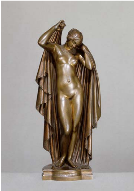
9– James Pradier, Phryné remettant ses voiles , avant 1852, bronze, 39,8 x 16,5 cm, Paris, musée du Louvre, département des Sculptures, RF 4273