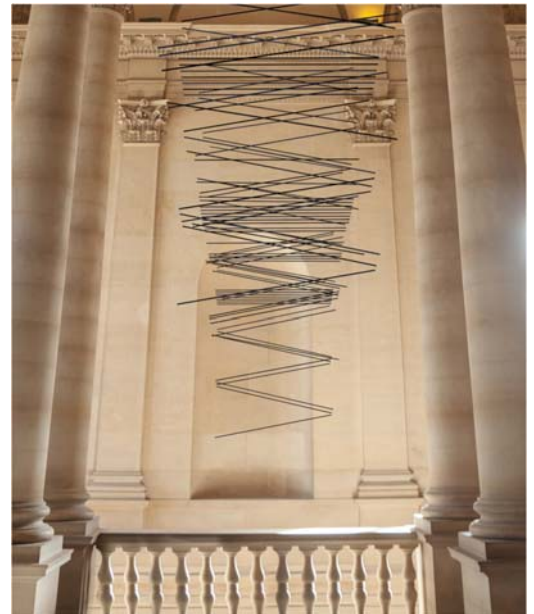
Elias Crespin, L'Onde du Midi (simulación) © Elias Crespin. Visuel Pascal Maillard

Desde entonces, sus esculturas móviles han integrado colecciones de prestigio, entre ellas la del Museo de Bellas Artes de Houston, la del Museo del Barrio de Nueva York y la del Museo de Arte Latinoamericano de Buenos Aires. En 2018, participó en la exposición «Artistas y robots» del Grand Palais (París), donde expuso Grand HexaNet . Desde el 2008, vive y trabaja en París, donde está representado por la galería Denise René.