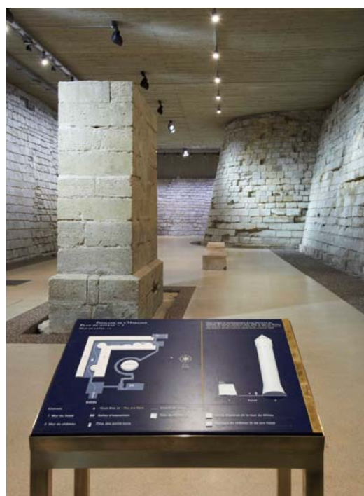
Un dispositif tactile du Pavillon de l'Horloge

www.louvre.fr/professionnels-associations/handicap