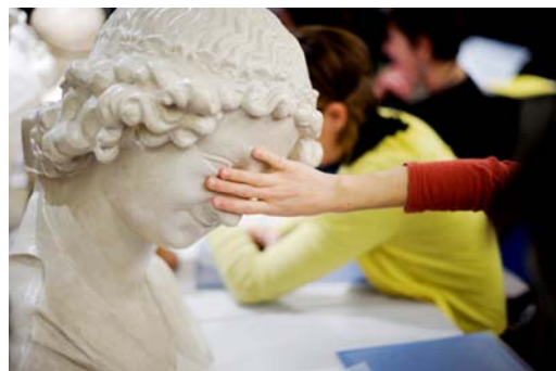
Semaine de l'accessibilité au Louvre