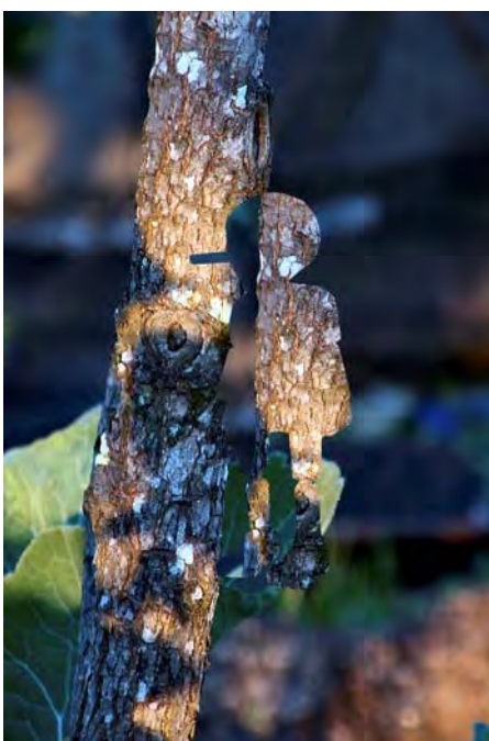
La Vérité sur Pinocchio

Rendez-vous à partir du 11 octobre 2015 sur http://petitegalerie.louvre.fr et sur l'application Petite Galerie pour une sélection d'œuvres commentées et des récits de mythes.