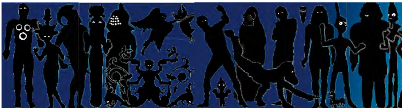
Frise des héros du Louvre, dans le couloir de sortie de l'exposition

- des dispositifs itinérants, pour aller au-devant de tous les publics (écoles, médiathèques, centre sociaux, entreprises, hôpitaux, ...).