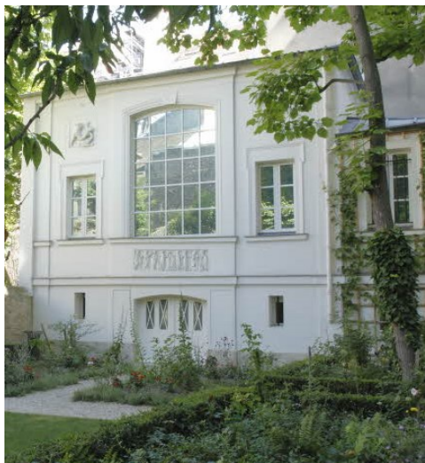
Jardin Delacroix