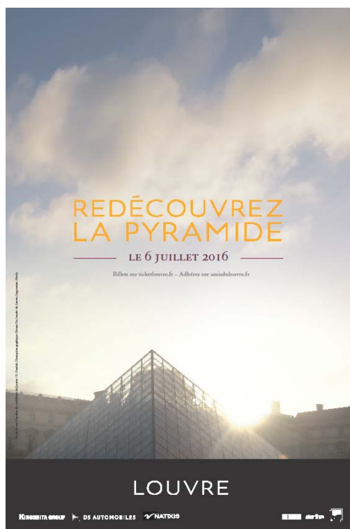
© 2013 musée du Louvre / Olivier Ouadah © Dream On