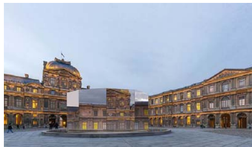
Eva Jospin. Panorama © Eva Jospin. Architecture Outsign. Courtesy Noirmontartproduction.

Le musée national Eugène-Delacroix a accueilli 58 148 visiteurs, soit une progression de 13%, fait remarquable dans le contexte actuel, qui s'explique par le caractère intimiste du lieu, moins affecté par les mesures du plan Vigipirate.