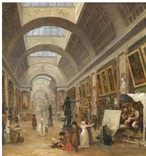
Hubert Robert, Projet pour la Transformation de la Grande Galerie (détail)