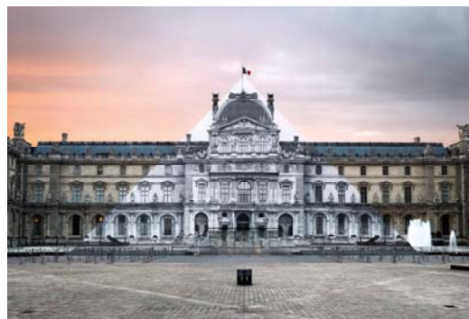
JR au Louvre © JR-ART.NET