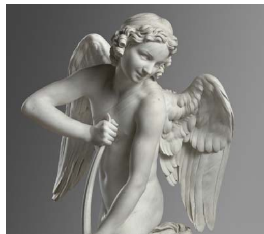
Edme Bouchardon, L'Amour se faisant un arc de la massue d'Hercule . Musée du Louvre