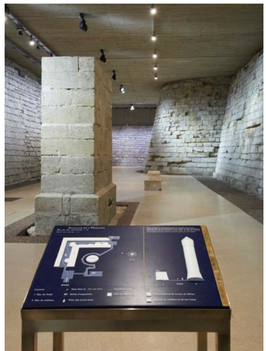
Un dispositif tactile du Pavillon de l'Horloge