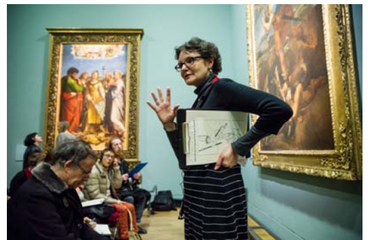
Visite pour un public malvoyant

« Colonne vertébrale » au cœur du musée, le Pavillon de l'Horloge donne des clés de compréhension du Louvre, d'abord palais des rois puis musée universel. Dans quatre salles réparties sur trois niveaux, le Louvre se présente et se raconte, grâce à des œuvres d'art, des maquettes interactives, des photographies ou des films. Dans chacun des espaces, des maquettes tactiles sont positionnées pour compléter le propos et le rendre accessible au public aveugle ou malvoyant, grâce à des volumes en 3D, des dessins tactiles, des textes en français grands caractères et en braille.